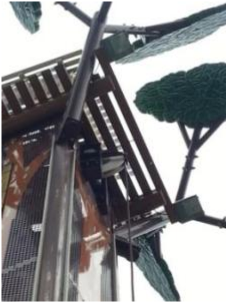
照片 5-1 維修完成後