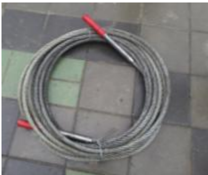
照片3 更換之鋼索新品