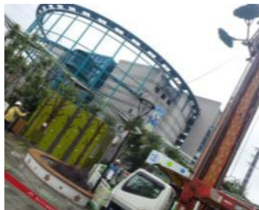
照片 4-2 維修處理中