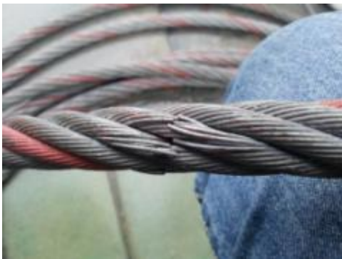
照片 6 換下之鋼索