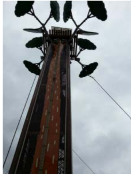
照片 5-2 維修完成後