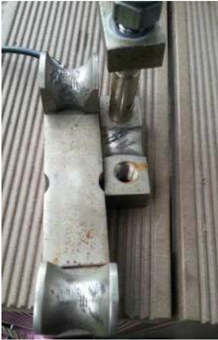
照片1:載重量測元件摩擦痕跡。