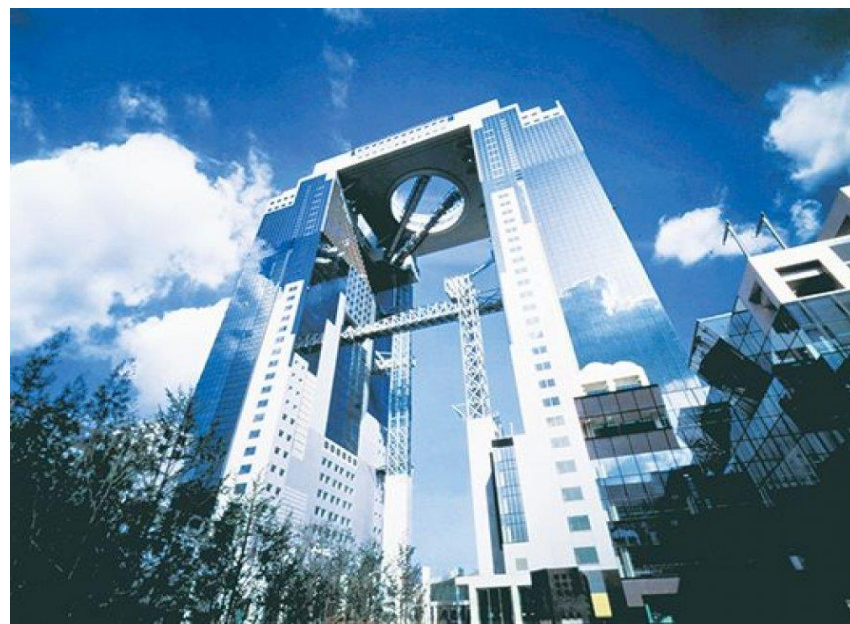
梅田藍天大廈 空中庭園展望台