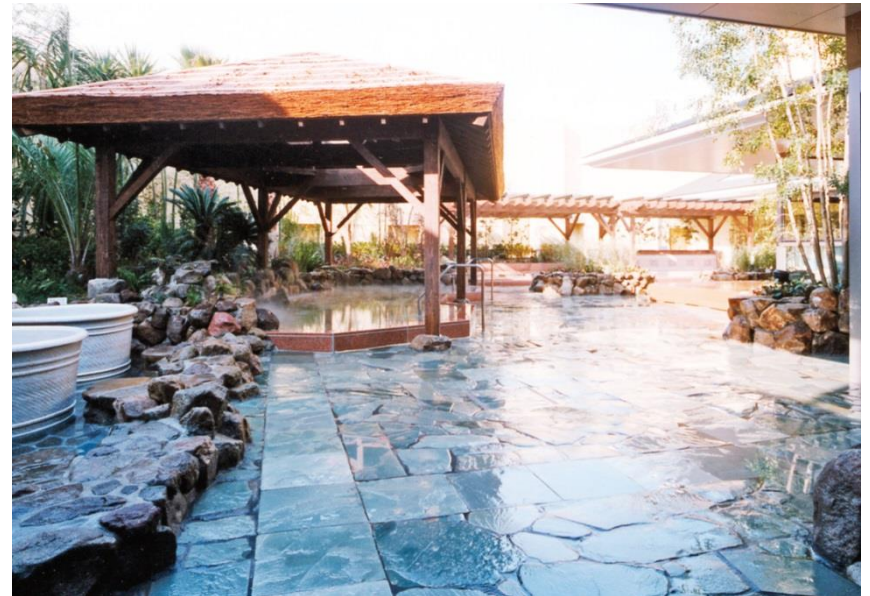
天然溫泉 浪速之湯