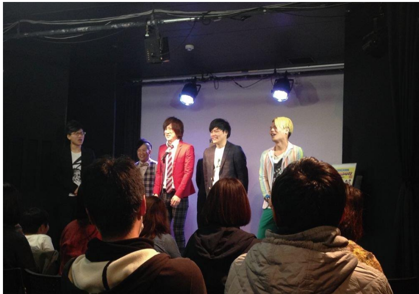
道頓堀ZAZA POCKET 'S ZAZA現場搞笑表演